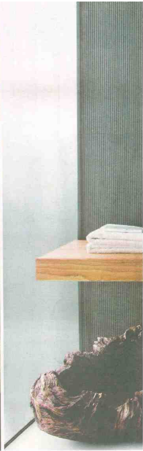
אריחי אנדרגראונד של CIR איטליה לבנים מפירוק החל 2000 שח להשיג ברשת נגב

קייס סטאדי ברמה בינלאומית של עיצוב אורבני, היא מובילה בעולם בכל סצינת העיצוב, האופי-נה, התרבות, המעודנים, התערוכות, המסעדות והגרומה שבא לידי ביטוי בכל תחום. אומרים על תל אביב שהיפוי שלה הוא בעיקר באנשיה, גלריית הטיפוסים הסגנוניים החולפים ברחבות היא מגוונת ומרתקת. החל מאנשי עסקים, אנשי האופנה, אנשי הבהמה, האומנים, היוצרים, המשפחות, עם הכלב, על האופניים, במכוניות צנועות או מהודרות. מרתק לפגוש אותם תוך כדי שיטוט בעיר ובמבט על האנשים, על איך הם לבושים, במה הם עסוקים, איך הם הולכים ואיך הם מדברים אפשר לדמיון גם איפה הם חיים". האנשים בתל אביב, היא ממשיכה, "הם בדרך כלל מיקרוקוסמוס לבית שלו, תמיד יהיה חיבור בין הזהויות האופנתית של האנשים לבין הסגנון גית של ביתם. בתל אביב ניתן לראות שפע אדיר של סגנונות שונים ולכל אחד יש מקום. אין אסור או מותר, אין נכון או לא נכון, לכל אחד הסגנון שלו והיפוי שלו".