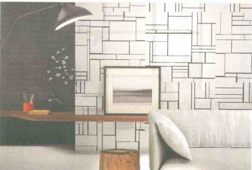
עיצוב עירוני בבית ויה ארקדיה

באיזור המהפכה התעשייתית כשהאסתטיקה של בתי המלאכה והחרושת החלה לצבור תאוצה בבתי המגורים, החנויות ומבני הציבור. "הז'אנר העיצובי מבוסס על מכאניקה, מערכות חשופות, חללים פתוחים וחומרים תעשייתיים ונוכחים כגון בטון, זכוכית, מתכת וכיוצא בזה, המייצרים מראה מהוקצע ומר-קפד. על מנת לייצר חמימות בחללי המגורים, נהוג לשלב פירטי ריהוט מעץ טבעי ולא מעורבד כמו גם טקסטיל בהיר ורך בכדי לרכך ולאזן את המעטפת הקרירה".