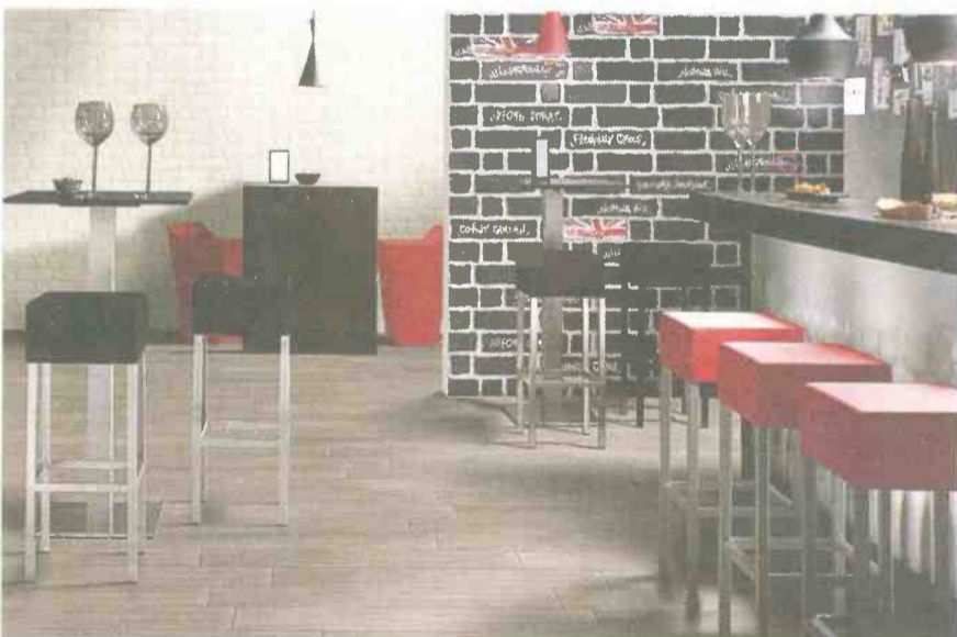
אריחי אנדרגראונד של נגב