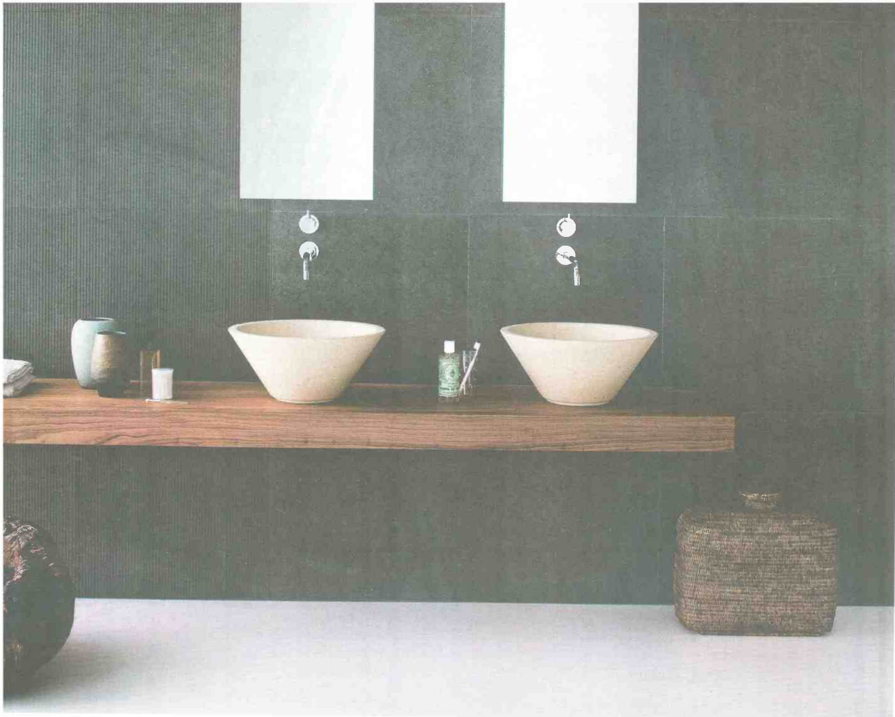
NEUTRA בניה ארקדיה