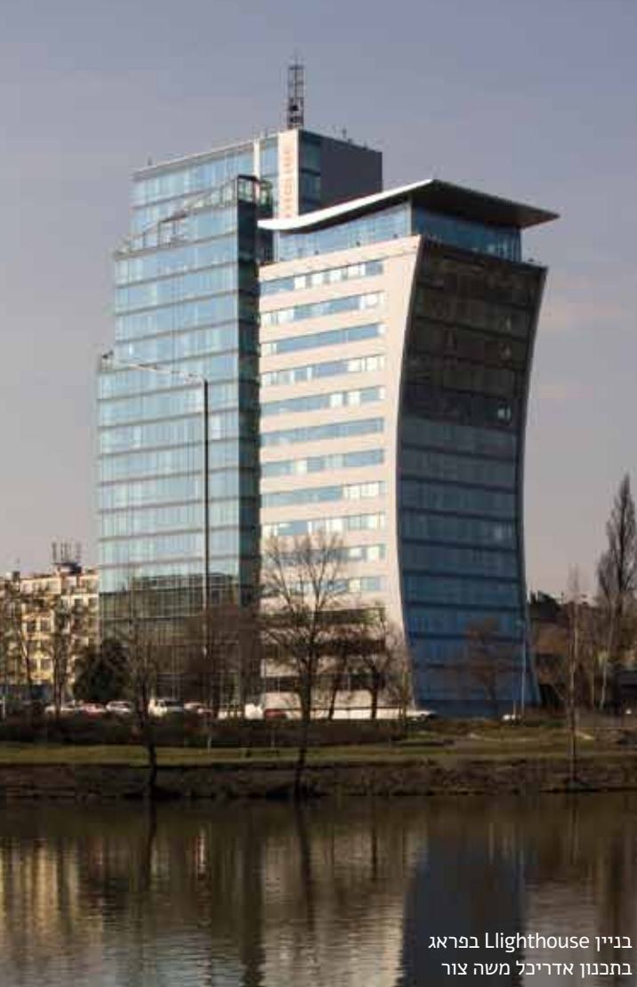
בניין Lighthouse בפראג בתכנון אדריכל משה צור