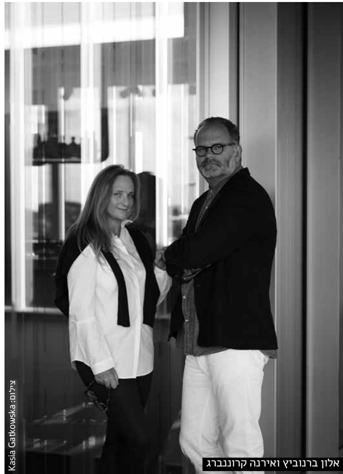
צילום: Kasia Gatkowska