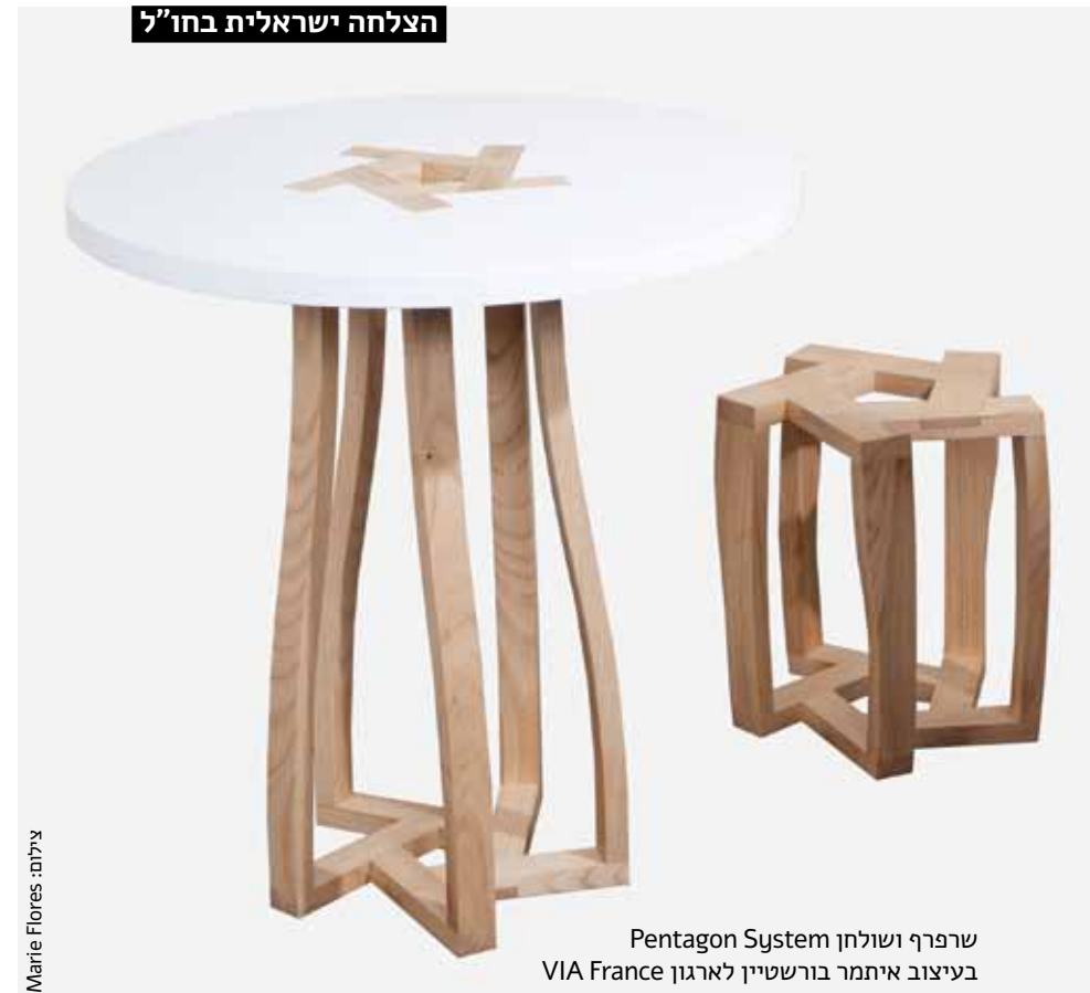
שרפרף ושולחן Pentagon System בריצ'רד בורשטיין לארגון VIA France בעיצוב איתמר בורשטיין

פרסים נחשבים. עבודותיהם נכללות באוספים של גלריות ומוזיאונים בעולם.